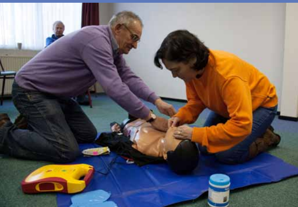
Vrijwilligers oefenen reanimatietechnieken tijdens een training

“Tegelijkertijd kan de AED een essentiële rol spelen bij het op gang brengen van een haperend hart. Via elektroden die door de vrijwilliger worden aangebracht, registreert de AED of er inderdaad een hartstilstand plaatsvindt en dient zo nodig een corrigerende stroomstoot toe. Als dat binnen vijf minuten gebeurt, is de overlevingskans meer dan 50 procent.”